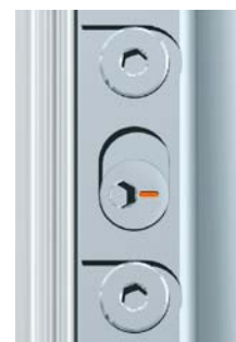
+ 2 mm