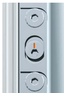
Posición neutral Posizione zero Posição zero