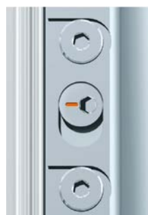
– 2 mm